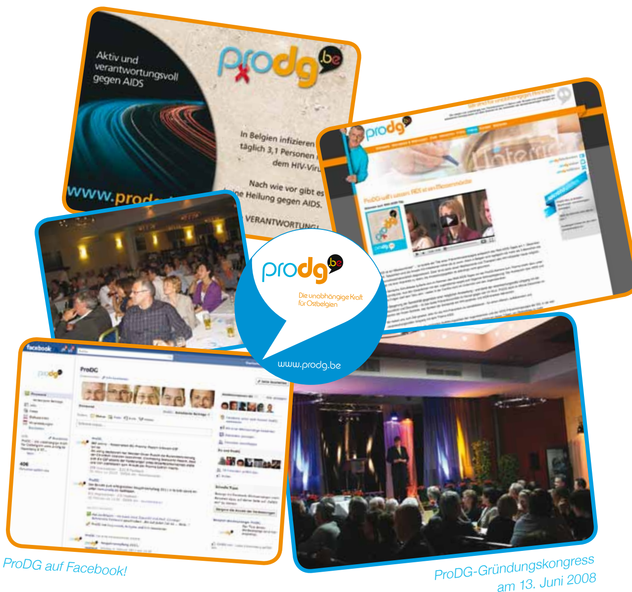
ProDG auf Facebook!